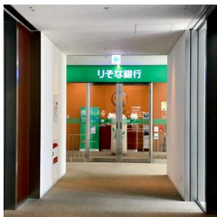
7 エレベーターを降りりそな銀行方面に向かいます。