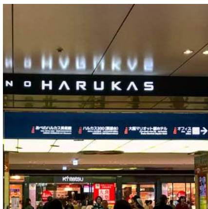
2 あべのハルカスオフィス方面へ向かいます。