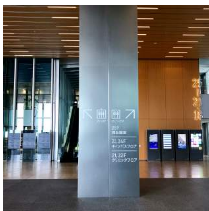
5 右端の25-21・18F行きエレベーターにのります。