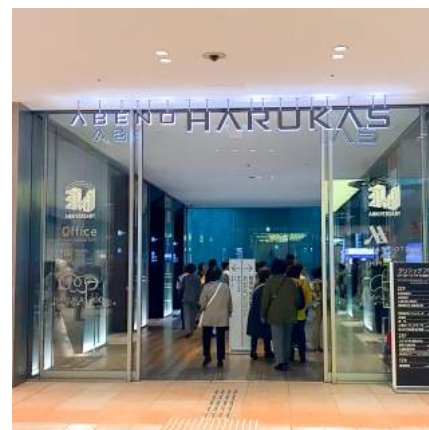
3 あべのハルカス入り口です。