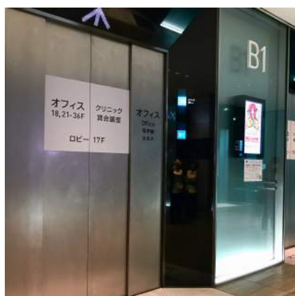
4 左側エレベーターにのり、ロビー17Fへ向かいます。