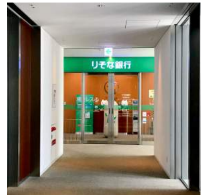
9 エレベーターを降りりそな銀行方面に向かいます。