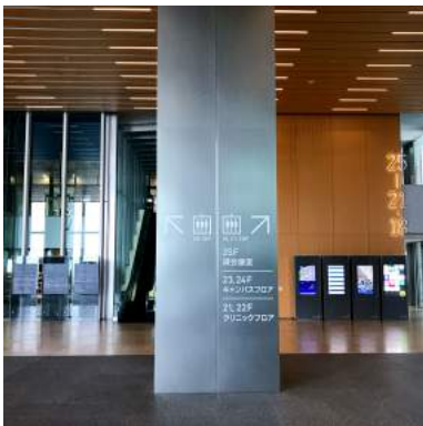
7 右端の25-21・18F行きエレベーターにのります。