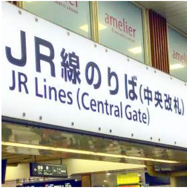
1 中央改札から出ます。