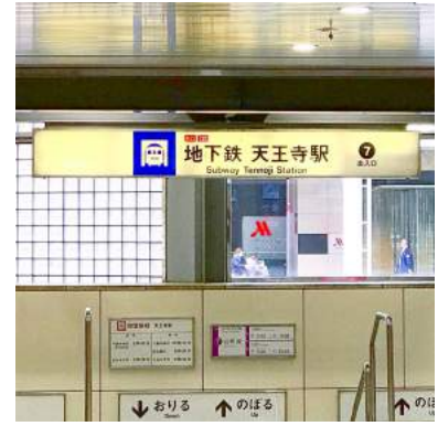
3 7番出入口を下ります。