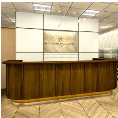
10 奥に向かって歩いていただくとつかはらクリニックがあります。