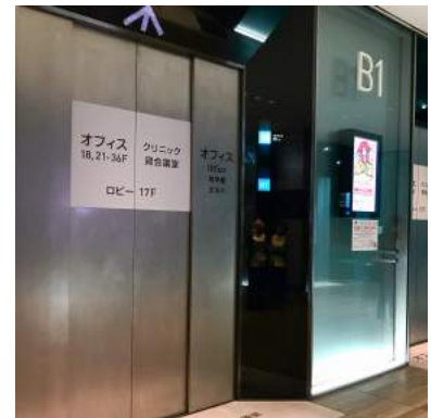
6 左側エレベーターにのり、ロビー17Fへ向かいます。