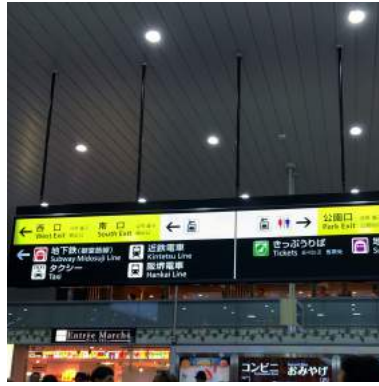
2 南口方面へ向かいます。