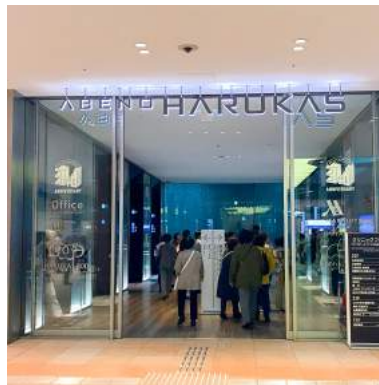
5 あべのハルカス入り口です。