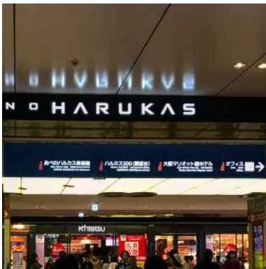
4 あべのハルカスオフィス方面へ向かいます。