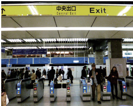
①中央出口から出ます。