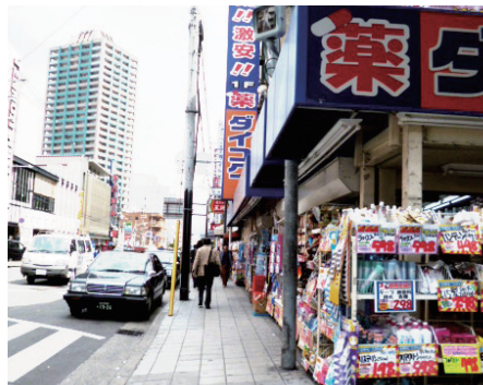
⑥左側の大通りに面した方の歩道を直進して下さい。