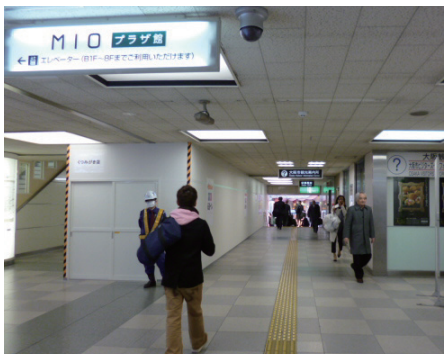
④北口出口に向かいます。