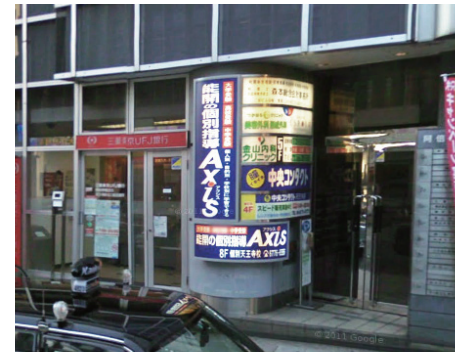
⑩入口はUFJ銀行ATMの右手にあります。