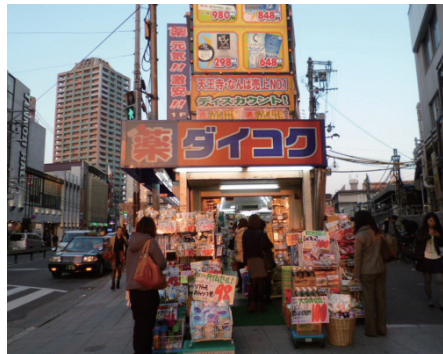
⑤北口出口を出ると右手にダイコクドラッグがあります。