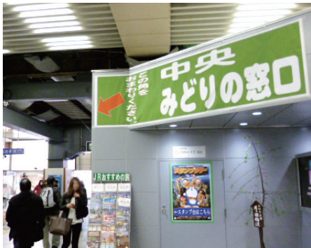
③みどりの窓口を直進します。