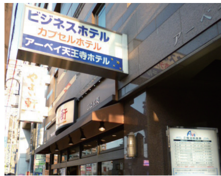
⑧さらに進むとアーベイ天王寺ホテルがあります。

美容外科・形成外科・皮膚科 つかはらクリニック ご予約・お問合せ ☎06-6772-2002