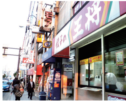
⑦直進すると餃子の王将があります。